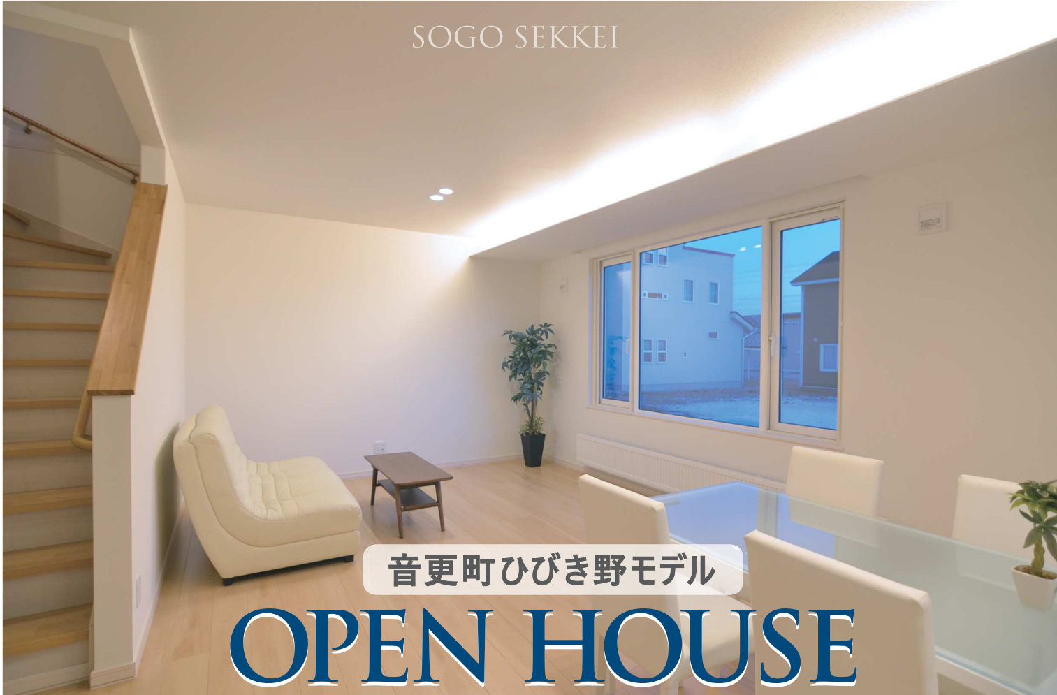
音更町ひびき野モデル