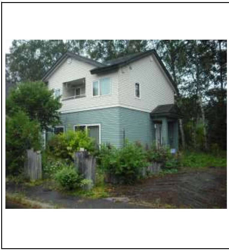
現況写真(H30年8月下旬 南側道路より撮影)