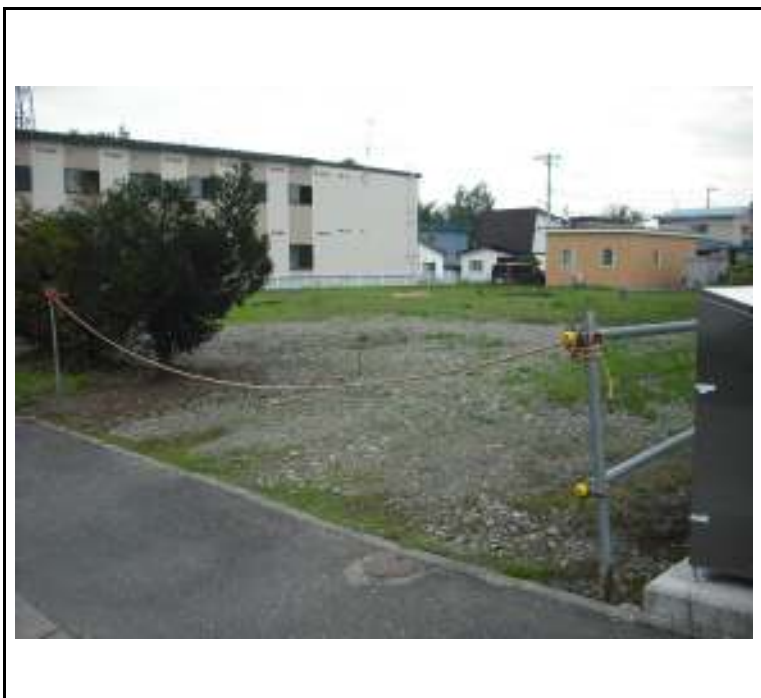
現況写真(東側国道側より撮影)