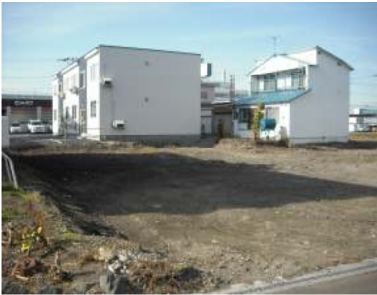
手前の更地が対象物件